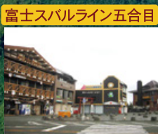
富士スバルライン五合目