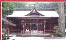
富士山東口本宮 富士浅間神社