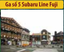
Ga số 5 Subaru Line Fuji