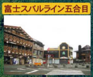
富士スバルライン五合目