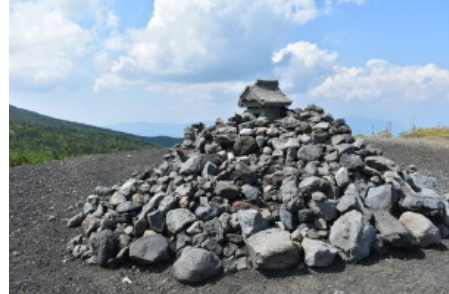
小富士の祠 パワースポットとされています。