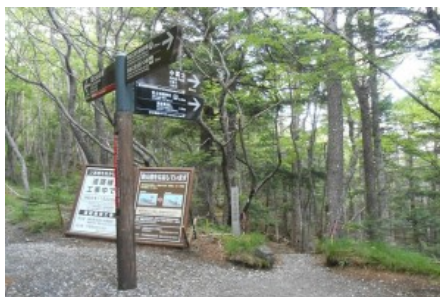
小富士遊歩道の入り口

須走口五合目入り口手前を右に行くと小富士遊歩道の道標がありそこから小富士まで樹林帯が続きます。 ここはかつて富士山信仰（富士講）の修練の場だったそうです。 小富士までの続く樹林帯は当時の雰囲気そのまま伝わってきそうな神秘的で荘厳な景色が続きます。