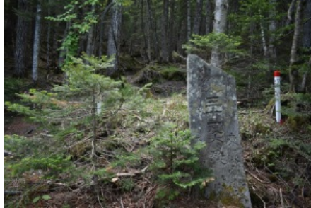
「三十三度 大願成就」と掘られた富士講碑

小富士山頂の近くには富士講碑がたたずんでいます。 先達と呼ばれる富士講のリーダー的な立場にあった人たちがその回数を刻んだものを建立したそうです。「三十三回」なのか「さんど、さんど（毎回）」なのかいずれにしても何度も繰り返す修練の厳しさが伝わってきます。また、小富士山頂にある祠はパワースポットとされています。