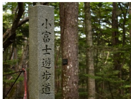
入り口を示す道標