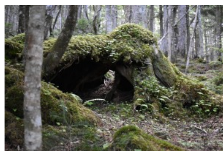
森のコビトでも棲んでいそうな苔むした朽ち木の穴