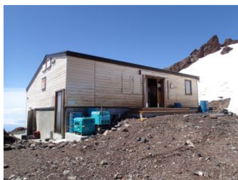
富士山頂公衆トイレ

※富士山頂は特殊な環境にあるため水道がありませんが、各個室に消毒ジェルを設置していますので、そちらをご利用下さい。