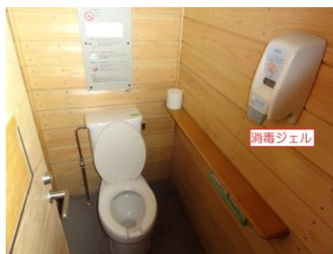
富士山頂公衆トイレに設置されている消毒ジェル