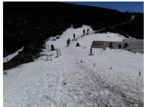
御殿場口山頂の様子 まだまだ残雪があるので、注意して通行下さい。