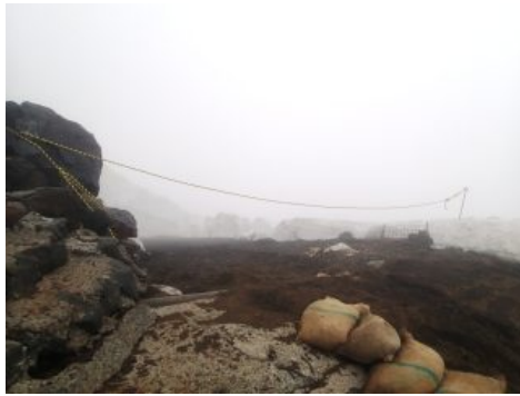
剣ヶ峰の様子 剣ヶ峰下のお鉢めぐり歩道には、2 m以上の雪が積もっています。