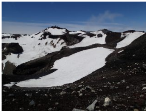
7月8日時点での剣ヶ峰付近の様子 お鉢めぐり歩道に残雪が見られます。