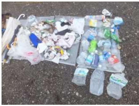
須走ルートで回収したゴミ 4.1kg

須走ルートはトモエシオガマ、ヤマホタルブクロ、トリカブト、ムラサキモメンヅルなど、たくさん の花を鑑賞しながらパトロールすることができました。