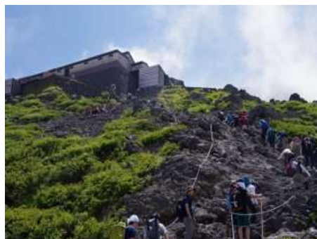
渋滞気味の登山道