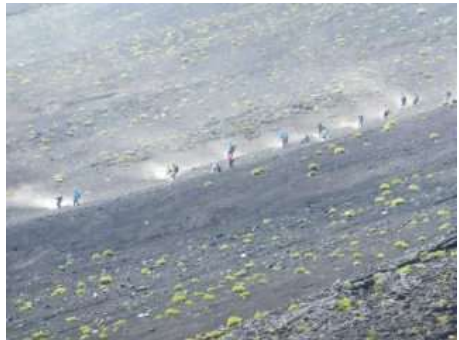
砂煙を上げる砂走り