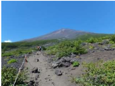
五合目～六合目間の登山道より